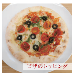
ピザのトッピング