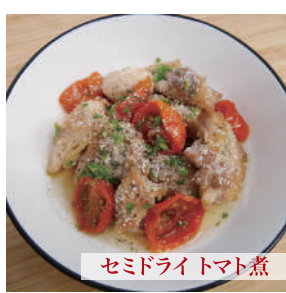
セミドライトマト煮