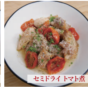
セミドライトマト煮