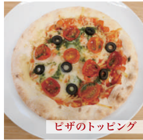
ピザのトッピング