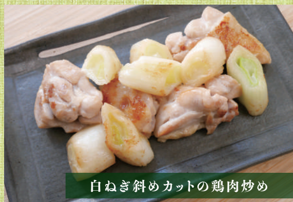
白ねぎ斜めカットの鶏肉炒め