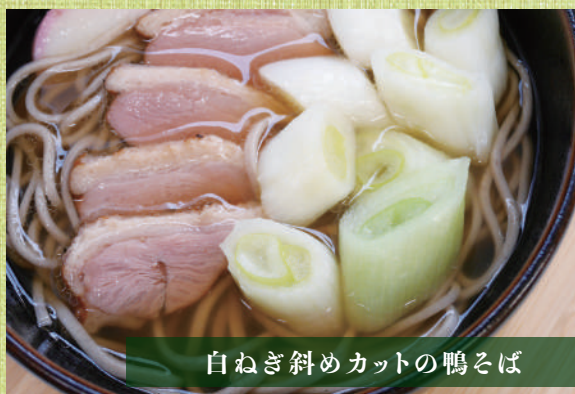
白ねぎ斜めカットの鴨そば

【メニュー例】 麺類(うどん・そば)、鍋の具材、みそ汁、炒め物など、様々な用途で大活躍!