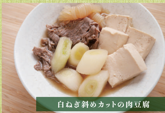
白ねぎ斜めカットの肉豆腐