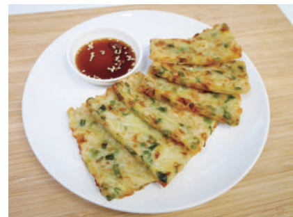
※タレはついておりません